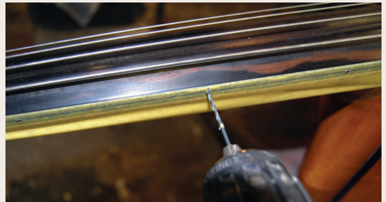
2. Plak de zijkant af met tape en boor gaatjes