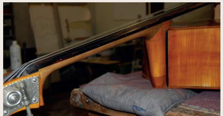
4. Voilà, je contrabas heeft nu positiestippen